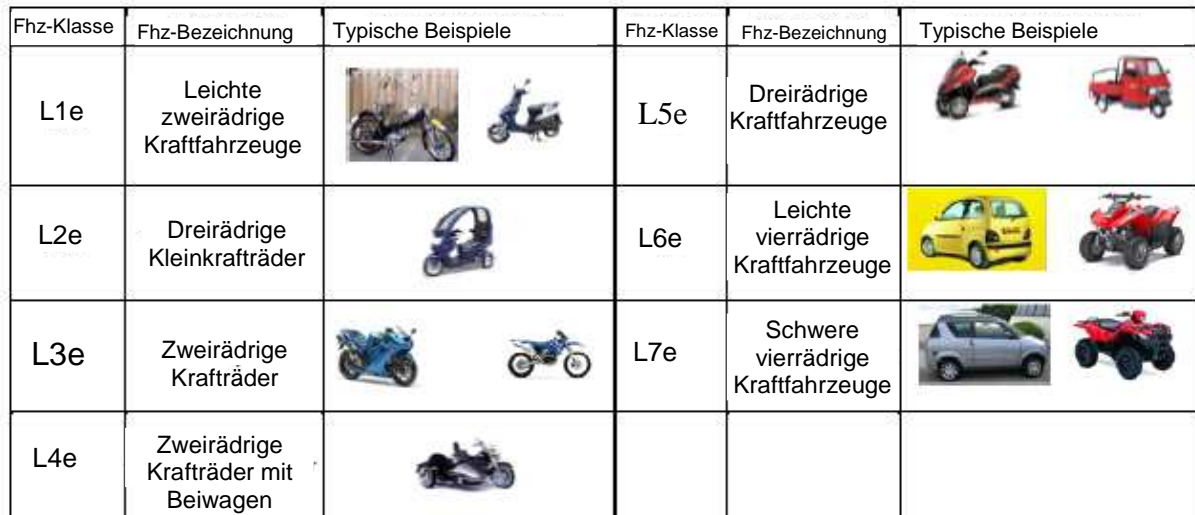
Abbildung 1: Beispiele für Fahrzeuge, die unter die aktuelle Rahmenrichtlinie 2002/24/EG fallen

Der Begriff „Fahrzeuge der Klasse L“ erfasst ein breites Spektrum unterschiedlicher Kraftfahrzeugtypen mit zwei, drei oder vier Rädern, z. B. Fahrräder mit Hilfsmotor, zwei- und dreirädrige Kleinkrafträder, zwei- und dreirädrige Krafträder und Krafträder mit Beiwagen. Beispiele für vierrädrige Kraftfahrzeuge der Klasse L sind für öffentliche Straßen ausgelegte Quads und Leichtkraftfahrzeuge.