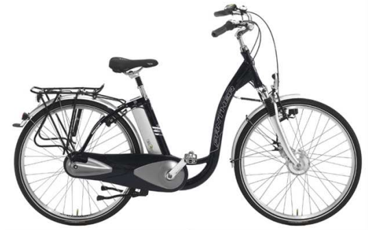
Pedelec mit Mittelmotor

Diese Konstruktionen haben unterschiedliche Vorteile, die unter anderem für unterschiedliche Zielgruppen verwendet werden können.