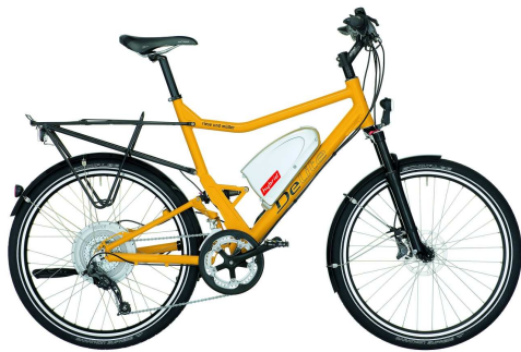
Pedelec mit Motor in der Hinterrad-Nabe

In den letzten Jahren haben sich im Bereich der Pedelecs viele unterschiedliche Antriebskonzepte entwickelt. Die Antriebsmotoren sind in der Vorder- oder Hinterradnabe sowie im Tretlager integriert.