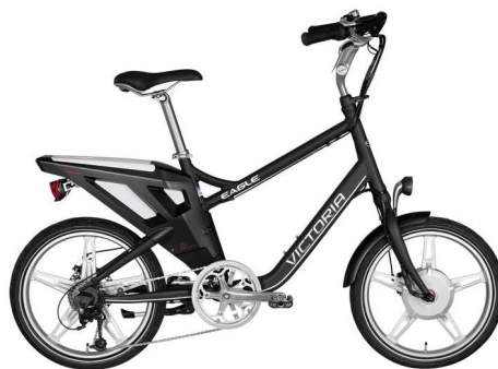
Pedelec mit Motor in der Vorderrad-Nabe

Einer der wichtigsten Faktoren für die positive Marktentwicklung von Pedelecs war der technische Fortschritt im Bereich der Batterietechnologie. Während vor rund 15 Jahren noch Blei-Gel- und Nickel-Cadmium-Akkus eingesetzt wurden, werden seit ca. 3-4 Jahren verstärkt Lithium-Ionen-Akkus verwendet. Diese weisen bei niedrigerem Gewicht eine größere Kapazität auf und ermöglichen somit eine größere Reichweite bei gleichem Gewicht.